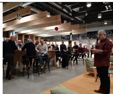
Speech van de voorzitter tijdens de nieuwjaarsborrel