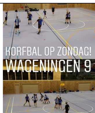
Het 9 e speelde voor het eerst thuis