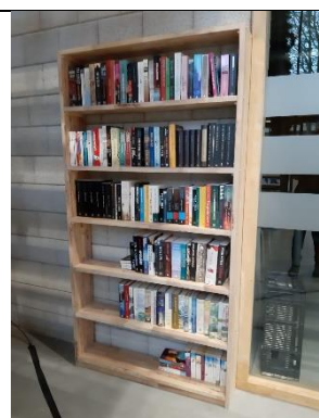
Het Binnenveld heeft een minibieb!