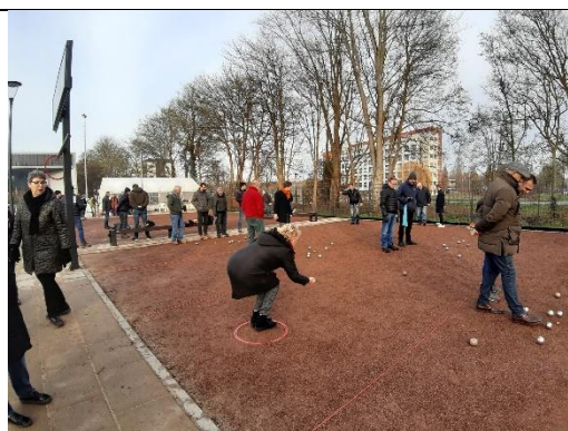
Koude Ballen toernooi in actie