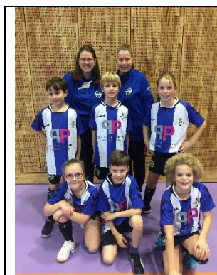
1 e teamfoto van 2020 (eigenlijk de laatste van 2019): E6

Heeft u leuke korfbalfoto's die u graag terug wilt zien in de weekbrief zet deze dan niet alleen op twitter, facebook of instagram, maar mail deze ook naar weekbrief@kvwageningen.nl .